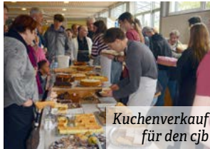
Kuchenverkauf für den cjb