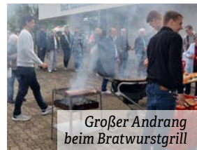
Großer Andrang beim Bratwurstgrill