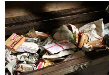
Eine Truhe voll Süßigkeiten

Verschiedene Bastelarbeiten lockten die Handwerker unter uns in den Keller. Richtig coole Sachen haben wir da gebaut.